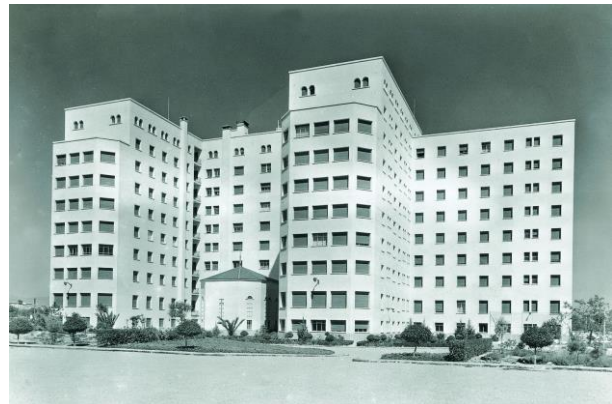
Imágenes de la "Residencia" en 1956. Observen la orientación y las abundantes ventanas

Los quirófanos se ubican estratégicamente para que, entre la claridad a través de grandes ventanales, pero sin la incidencia directa del sol para que el calor no obstaculice la actividad del personal quirúrgico que soporta su ropa y equipos de protección. Otros importantes avances en la seguridad de los pacientes fue la de delimitar las zonas de paso y ascensores de modo que estaban diferenciados los de público y los de tránsito de pacientes hacia quirófano desde hospitalización. También se evitaron las típicas salas de hospital con muchos pacientes separados únicamente por cortinas y en su lugar había habitaciones con espacio "vital" adecuado. Se contaron con espacios específicos tanto para trabajo como para descanso de las enfermeras.