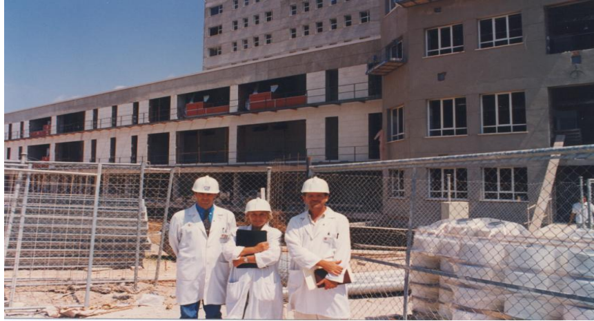
Equipo Directivo de Enfermería asesorando durante las obras del Plan Director

Incluso años después, con motivo de la reforma integral del Hospital mediante el denominado “Plan Director” (1995-2003), se siguieron incorporando ideas aportadas por enfermeras en un claro ejemplo de liderazgo encaminado al bienestar de los pacientes.